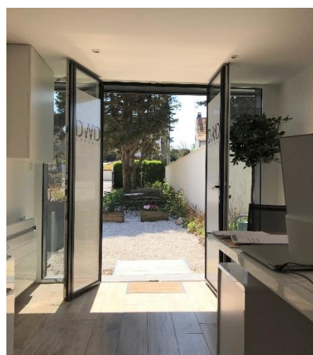
Ouverture de porte 1,16 m